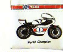
Geldbörse - Kunstleder „World Champion“