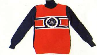
Rollkragenpullover Baumwolle mit Acryl

Größen Best.-Nr. 39 0055939 40 0055940 41 0055941 42 0055942 43 0055943 44 0055944 45 0055945 46 0055946