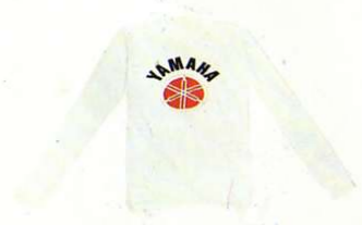
Leichtes Sweat-Shirt weiß, Baumwolle

Größen Best.-Nr. XS 0048100 S 0048200 M 0048300 L 0048400 XL 0048500