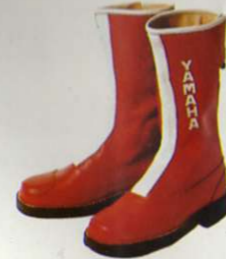
Rennstiefel stabiles Rindleder, rot

Größen Best.-Nr. 36 0055836 37 0055837 38 0055838 39 0055839 40 0055840 41 0055841 42 0055842 43 0055843 44 0055844 45 0055845 46 0055846