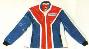
Anorak gefüttert, im YAMAHA-Look

Typen Best.-Nr. bis Modell '77 RD 250/400 0049100