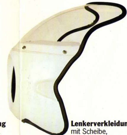
Lenkerverkleidung mit Scheibe, optimales Styling.

Typen Best.-Nr. XS 250 0064810 XS 360 XS 400 SR 500 0064800