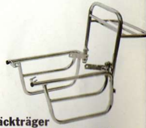
Gepäckträger verchromte Stahlrohrausführung

Typen Best.-Nr. FS 1-G 0012200 RD 50 M 0012320 RD 50 DX 0012310 RS 100 0012410 RD 200 0012850