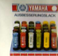
Ausbesserungsfarbstifte für alle Modelle

Größen Best.-Nr. S 0061500 M 0061501 L 0061502 XL 0061503