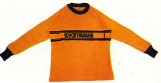
Sporttrikot Acryl, orange, für Motocross-Fahrer

Größen Best.-Nr. S 0043300 M 0043400 L 0043500