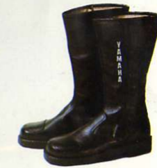
Winterstiefel mit langem Schaft, schwarz. Für hohe Ansprüche

Größen Best.-Nr. 36 0011636 37 0011637 38 0011638 39 0011639 40 0011640 41 0011641 42 0011642 43 0011643 44 0011644 45 0011645 46 0011646