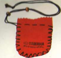
Brustbeutel aus feinem Leder