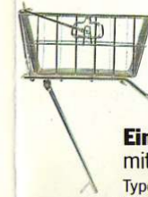
Einkaufskorb mit Gepäckträger

Typen Best.-Nr. RD 250/400 0013110 XS 360/400 0019400 XS 500 0013410 XS 650 0013200 XS 750 0019500 XS 1100 0019600 SR 500 0019510