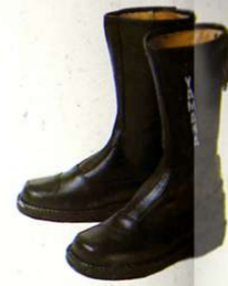
Rennstiefel, stabiles Rindleder, schwarz

Größen Best.-Nr. 36 0055836 37 0055837 38 0055838 39 0055839 40 0055840 41 0055841 42 0055842 43 0055843 44 0055844 45 0055845 46 0055846