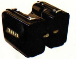
Kunststoff-Packtaschen Satz = 2 Stück, à 21 l, Farbe: Schwarz, passend für YAMAHA-Gepäckträger

Typen Best.-Nr. FS 1-M 0055100 RD 50 DX RD 50 M