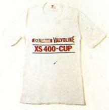
T-Shirt „XS 400 CUP“ Baumwolle

Größen Best.-Nr. XS 0048100 S 0048200 M 0048300 L 0048400 XL 0048500