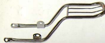
Gepäckträger für Enduros verchromte Stahlrohrausführung

Typen Best.-Nr. RD 250/400 0012030 XS 360/400 0018250 XS 500 0018150 XS 650 0012120 XS 750 0018350 XS 1100 0018550/55 SR 500 0018450/55