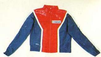
Blouson, leichte Ausführung, im YAMAHA-Look

Größen Best.-Nr. XS 0035110 S 0035210 M 0035310 L 0035410 XL 0035510