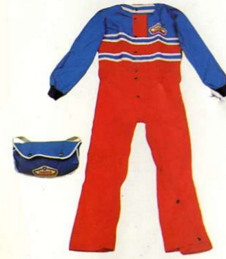
Regenkombi schwere Qualität, einteilig, 100% wasserdicht, für Motorradfahrer

Größen Best.-Nr. 2 0010702 3 0010703 4 0010704 5 0010705 6 0010706 7 0010707 8 0010708